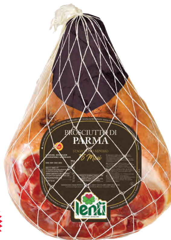
COD. 78711 Caratteristiche: disossato pressato