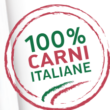
GRAND'ARROSTO DI SUINO ITALIANO