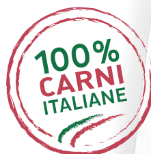
GRAN TACCHINO PETTO DI TACCHINO ARROSTO ITALIANO