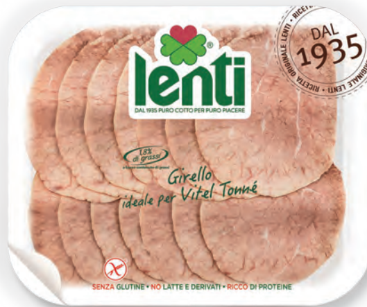
GIRELLO IDEALE PER VITEL TONNÉ