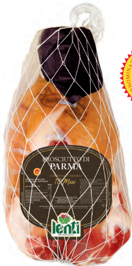
COD. 78710 Caratteristiche: disossato addobbo