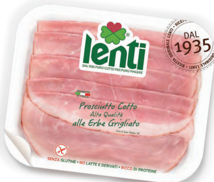
PROSCIUTTO COTTO ALLE ERBE GRIGLIATO ALTA QUALITÀ