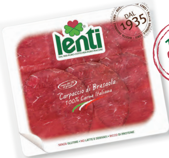
CARPACCIO DI BRESAOLA ITALIANO