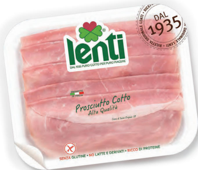
PROSCIUTTO COTTO ALTA QUALITÀ