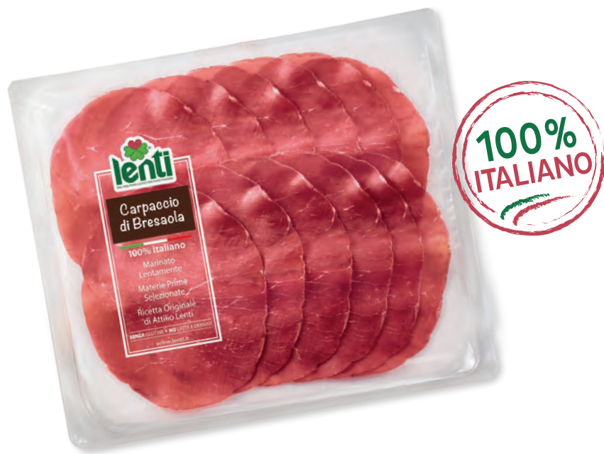
CARPACCIO DI BRESAOLA ITALIANO